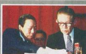
1998年股東會，和兄長王永慶討論議事內容。