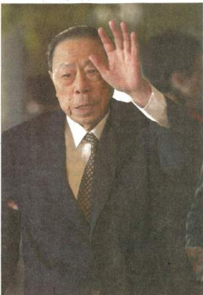
台塑企業創辦人王永在昨日(27)日上午11時15分，在台北市延壽街家中安詳辭世，享壽93。

【記者邱展光/台北報導】台塑集團創辦人王永在的三個兒子，在各領域表現出色，女婿在企業內的表現也可圈可點。這些對他來說，才是最豐碩的資產。王永在對兒子與女婿不僅注重言教，更重視身教，一有疏失，看到後馬上指正，而他們都沒讓王永在失望；對此，他感到很欣慰，與外人交談時，也不吝於讚賞。