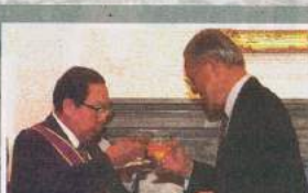
2000年4月，接受前總統李登輝頒贈二等奉勳章。