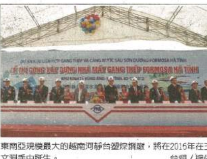
東南亞規模最大的越南河靜台塑煉鋼廠，將在2016年在王文淵手中誕生。

段建設。第一期先投資100億美元，預計年產粗鋼707萬噸並銷售鋼材682萬噸；自高爐打樁後，建廠工程將全面啓動，施工期將達30個月。 台塑集團主管表示，河靜鋼廠初期銷售以東南亞為目標市場。近年來，東南亞國家受工業化與城市化發展，鋼鐵需求量大增加，成為現今全球鋼鐵消費成長最快速的區域。